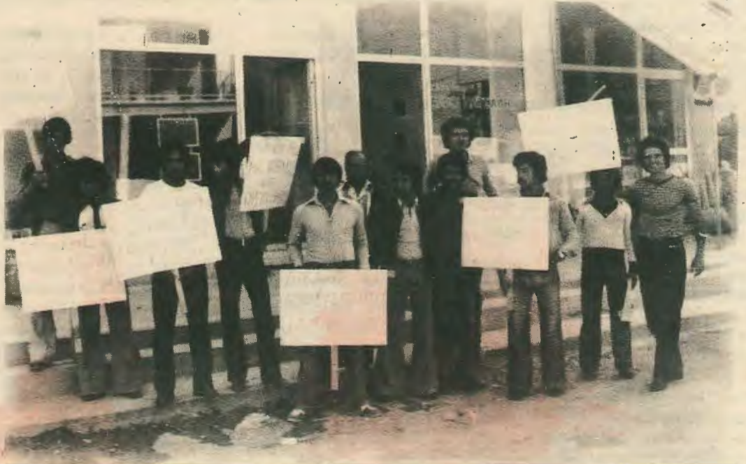
Απεργία διαρκείας στην C.A.C στην 8η σελίδα.

Το πρόβλημα του συνεργατισμού είναι πρόβλημα δομών, παρα από τα σκάνδαλα που έχουν παρατηρηθεί. Είναι λοιπόν άμεσο καθήκον η αλλαγή της νομοθεσίας, η εκδημοκρατικοποίηση του συνεργατισμού, η αφαίρεση των υπερεξουσιών από τη διοίκηση, έτσι που να γίνει δυνατή διοίκηση του συνεργατισμού από τους ίδιους τους συνεργατισμούς. Και τούτο πρέπει να είναι το πρωταρχικό αίτημα των συνεργατιστών: Να επιστρέψει ο συνεργατισμός σ' εκείνους που πράγματι ανήκει.